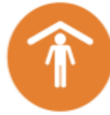
SHELTER IN PLACE