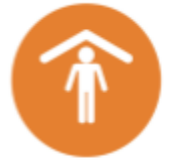
SEVERE WEATHER SHELTER

Los estudiantes, padres/tutores y el personal deben ser informados de las expectativas de cada simulacro en caso de una emergencia real.